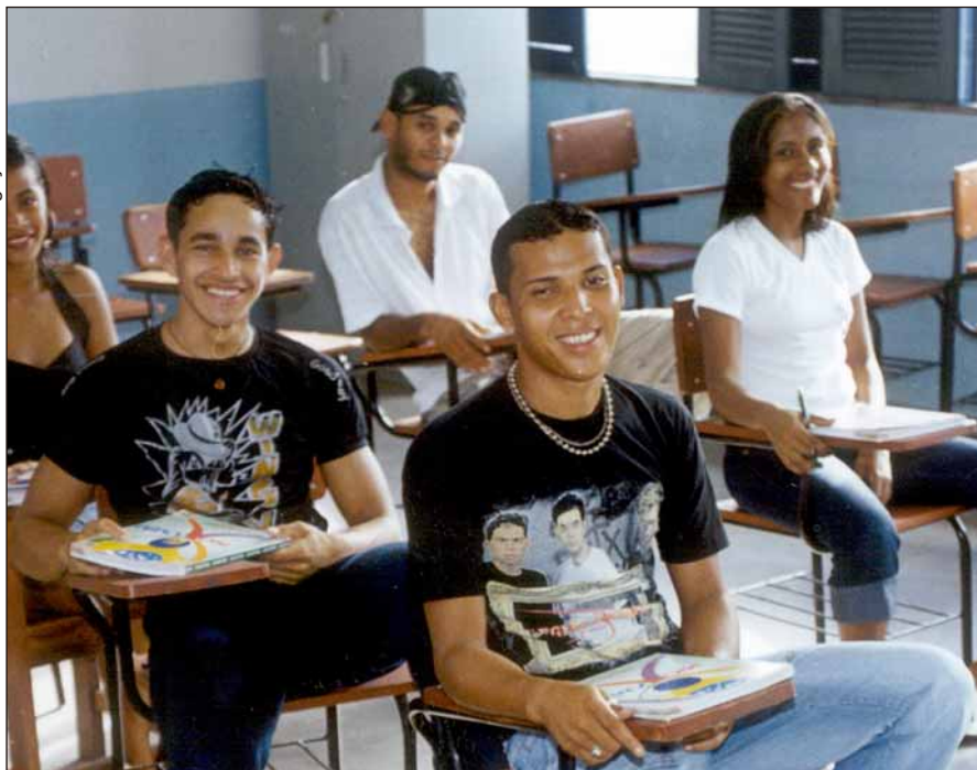
DESDE SETEMBRO de 2005, jovens freqüentam as aulas do ProJovem em Boa Vista (RR)