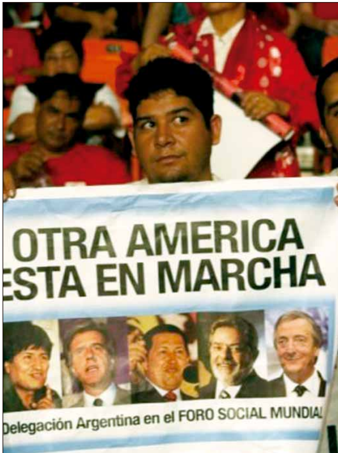
EM CARACAS, milhares de pessoas participam da marcha de abertura do VI Fórum Social Mundial

experiências inovadoras do governo brasileiro em políticas públicas, entre elas: direitos das mulheres, combate ao racismo, reforma agrária e preservação ambiental. Mas viemos também para conhecer a rica experiência da sociedade civil de outros países, porque o fórum não é uma reunião de autoridades governamentais, mas um encontro da sociedade civil internacional”, observou o ministro Luiz Dulci.