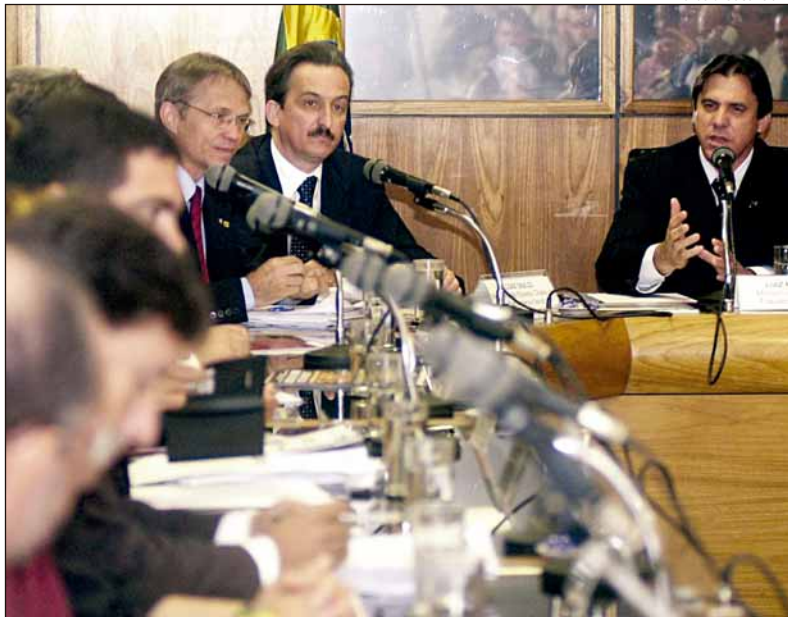
NEGOCIAÇÃO ENTRE governo e centrais sindicais assegura aumento no valor do salário mínimo

Além dos ministros Marinho, Dulci e Nelson Machado, da Previdência Social, participaram das negociações representantes do ministério do Planejamento e da Casa Civil. Os trabalhadores foram representados pela Central Autônoma de Trabalhadores (CAT), Central Geral dos Traba-