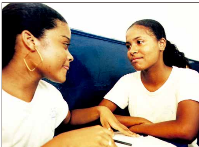
BRASIL ALFABETIZADO cria ações específicas para a juventude