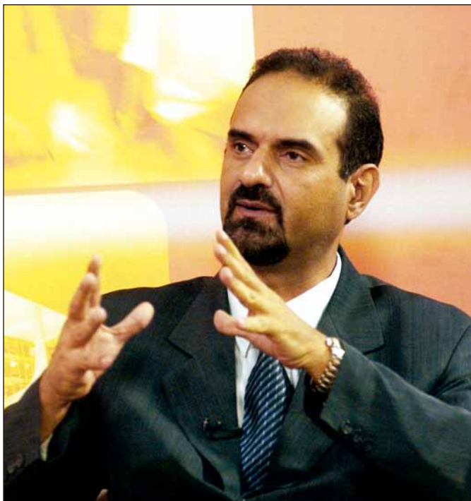
O SECRETÁRIO NACIONAL DE JUVENTUDE, Beto Cury, avalia avanços e desafios das políticas para os jovens